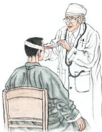
图 5

6.（情感共鸣维度）这幅图让我感到心情沉重/震撼。（非常不认同 不认同 一般 认同 非常认同）