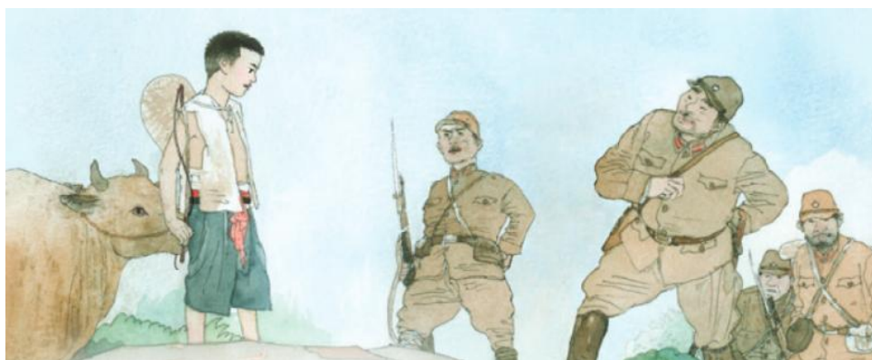
图 2（图源统编版小学语文二年级上册《王二小》）

2.（认知理解维度）看了这幅图，我更能明白课文讲的是什么故事。（非常不认同 不认同 一般 认同 非常认同）