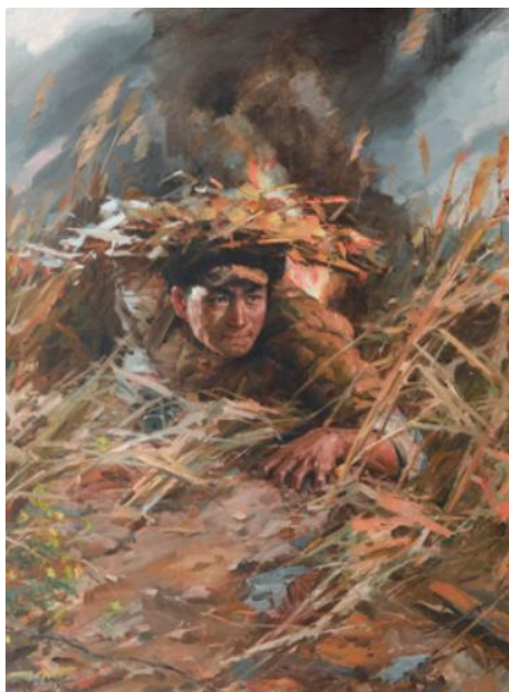
图 7 《邱少云》（孙国岐）