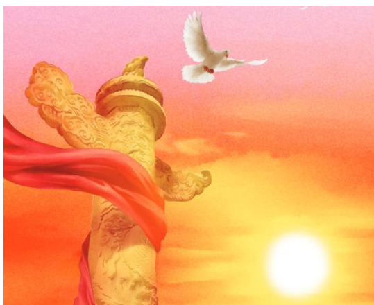
图 3

3.（审美接受维度）这幅图的颜色很吸引我。（非常不认同 不认同 一般 认同 非常认同）