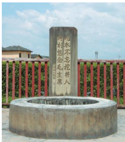
图 1（图源统编版小学语文一年级下册《吃水不忘挖井人》）

1.（认知理解维度）看了这幅图，我能更深刻地理解课文内容。（非常不认同 不认同 一般 认同 非常认同）