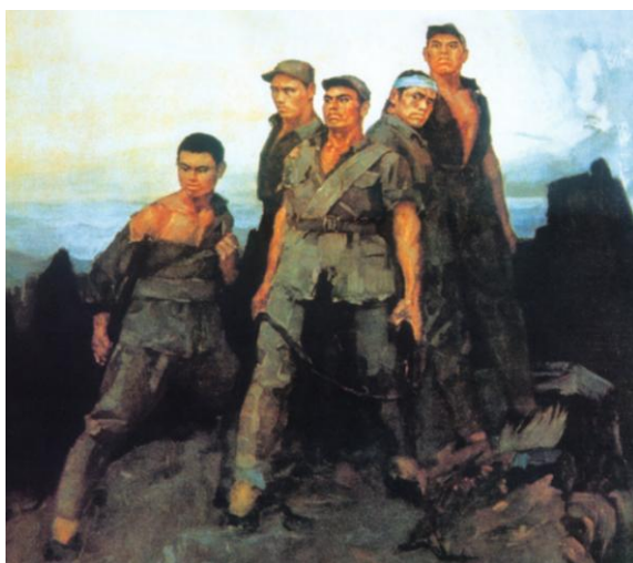
图 6（图源统编版小学语文六年级上册《狼牙山五壮士》）

6.（情感共鸣维度）这幅图让我感到心情沉重/震撼。（非常不认同 不认同 一般 认同 非常认同）