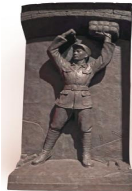
图 8 《董存瑞雕像》（刘开渠）